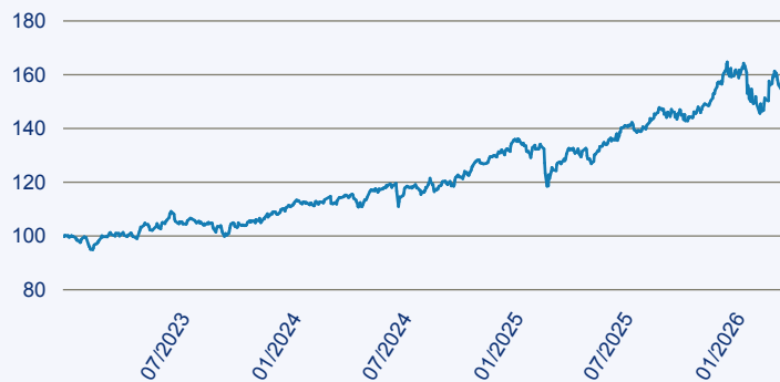
— JPM Middle East, Africa and Emerging Europe Opportunities A Acc EUR

Risiko: Die in der Vergangenheit erzielte Performance und die Erträge lassen keinen Rückschluss auf die zukünftige Performance und die Erträge des Fonds zu. Der Fonds ist weder mit einer Garantie noch mit einem Kapitalschutzmechanismus ausgestattet. Der in Euro umgerechnete Wert internationaler Anlagen des Fonds kann infolge von Wechselkursschwankungen (Währungsschwankungen) sowohl steigen als auch sinken. Der Wert des Fonds und damit der Wert ihres Investments kann gegenüber dem Einstandspreis steigen oder fallen.