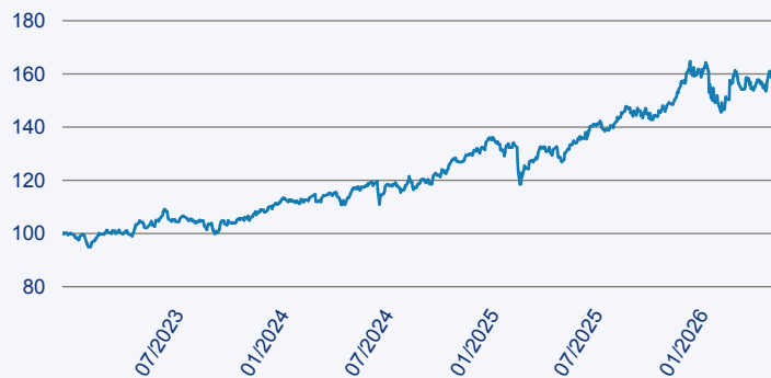
— JPM Middle East, Africa and Emerging Europe Opportunities A Acc EUR

Risiko: Die in der Vergangenheit erzielte Performance und die Erträge lassen keinen Rückschluss auf die zukünftige Performance und die Erträge des Fonds zu. Der Fonds ist weder mit einer Garantie noch mit einem Kapitalschutzmechanismus ausgestattet. Der in Euro umgerechnete Wert internationaler Anlagen des Fonds kann infolge von Wechselkursschwankungen (Währungsschwankungen) sowohl steigen als auch sinken. Der Wert des Fonds und damit der Wert ihres Investments kann gegenüber dem Einstandspreis steigen oder fallen.