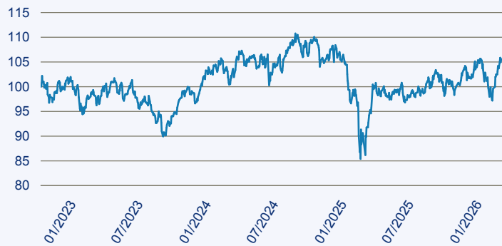
— abrdn SICAV II - Global Impact Equity Fund A Acc EUR

Risiko: Die in der Vergangenheit erzielte Performance und die Ertrage lassen keinen Ruckschluss auf die zukunftsige Performance und die Ertrage des Fonds zu. Der Fonds ist weder mit einer Garantie noch mit einem Kapitalschutzmechanismus ausgestattet. Der in Euro umgerechnete Wert internationaler Anlagen des Fonds kann infolge von Wechselkursschwankungen (Wahrungsschwankungen) sowohl steigen als auch sinken. Der Wert des Fonds und damit der Wert ihres Investments kann gegenuber dem Einstandspreis steigen oder fallen.