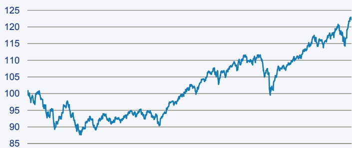
— Swisscanto (LU) Portfolio Fund - Sustainable Balanced (EUR) DT

Risiko: Die in der Vergangenheit erzielte Performance und die Erträge lassen keinen Rückschluss auf die zukünftige Performance und die Erträge des Fonds zu. Der Fonds ist weder mit einer Garantie noch mit einem Kapitalschutzmechanismus ausgestattet. Der in Euro umgerechnete Wert internationaler Anlagen des Fonds kann infolge von Wechselkursschwankungen (Währungsschwankungen) sowohl steigen als auch sinken. Der Wert des Fonds und damit der Wert ihres Investments kann gegenüber dem Einstandspreis steigen oder fallen.