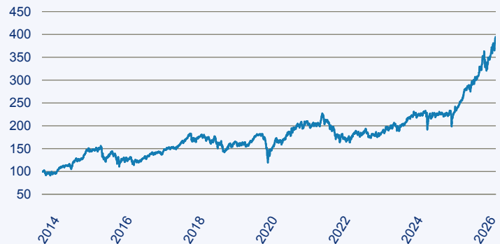
abrdrn SICAV I - Japanese Smaller Companies Sustainable Equity X Acc Hedged E

Risiko: Die in der Vergangenheit erzielte Performance und die Ertrage lassen keinen Ruckschluss auf die zukunftliche Performance und die Ertrage des Fonds zu. Der Fonds ist weder mit einer Garantie noch mit einem Kapitalschutzmechanismus ausgestattet. Der in Euro umgerechnete Wert internationaler Anlagen des Fonds kann infolge von Wechselkursschwankungen (Wahrungsschwankungen) sowohl steigen als auch sinken. Der Wert des Fonds und damit der Wert ihres Investments kann gegenuber dem Einstandspreis steigen oder fallen.