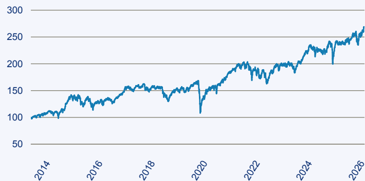
— Janus Henderson Horizon Fund - Pan European Mid and Large Cap Fund A2 EUR

Risiko: Die in der Vergangenheit erzielte Performance und die Ertrage lassen keinen Ruckschluss auf die zukunftige Performance und die Ertrage des Fonds zu. Der Fonds ist weder mit einer Garantie noch mit einem Kapitalschutzmechanismus ausgestattet. Der in Euro umgerechnete Wert internationaler Anlagen des Fonds kann infolge von Wechselkursschwankungen (Wahrungsschwankungen) sowohl steigen als auch sinken. Der Wert des Fonds und damit der Wert ihres Investments kann gegenuber dem Einstandspreis steigen oder fallen.