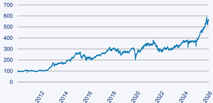
abrnd SICAV I - Japanese Smaller Companies Sustainable Equity A Acc Hedged E

Risiko: Die in der Vergangenheit erzielte Performance und die Ertrage lassen keinen Ruckschluss auf die zukunftsige Performance und die Ertrage des Fonds zu. Der Fonds ist weder mit einer Garantie noch mit einem Kapitalschutzmechanismus ausgestattet. Der in Euro umgerechnete Wert internationaler Anlagen des Fonds kann infolge von Wechselkursschwankungen (Wahrungsschwankungen) sowohl steigen als auch sinken. Der Wert des Fonds und damit der Wert ihres Investments kann gegenuber dem Einstandspreis steigen oder fallen.