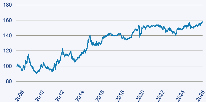
— Carmignac Portfolio Unconstrained Global Bond A EUR

Risiko: Die in der Vergangenheit erzielte Performance und die Ertrage lassen keinen Ruckschluss auf die zukunftige Performance und die Ertrage des Fonds zu. Der Fonds ist weder mit einer Garantie noch mit einem Kapitalschutzmechanismus ausgestattet. Der in Euro umgerechnete Wert internationaler Anlagen des Fonds kann infolge von Wechselkursschwankungen (Wahrungsschwankungen) sowohl steigen als auch sinken. Der Wert des Fonds und damit der Wert ihres Investments kann gegenuber dem Einstandspreis steigen oder fallen.