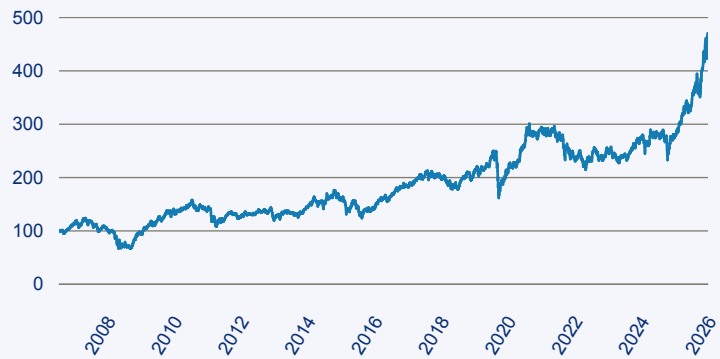
— Schroder ISF Global Emerging Market Opportunities EUR C ACC

Risiko: Die in der Vergangenheit erzielte Performance und die Erträge lassen keinen Rückschluss auf die zukünftige Performance und die Erträge des Fonds zu. Der Fonds ist weder mit einer Garantie noch mit einem Kapitalschutzmechanismus ausgestattet. Der in Euro umgerechnete Wert internationaler Anlagen des Fonds kann infolge von Wechselkursschwankungen (Währungsschwankungen) sowohl steigen als auch sinken. Der Wert des Fonds und damit der Wert ihres Investments kann gegenüber dem Einstandspreis steigen oder fallen.