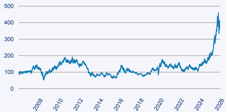
— BlackRock Global Funds World Gold D2

Risiko: Die in der Vergangenheit erzielte Performance und die Erträge lassen keinen Rückschluss auf die zukünftige Performance und die Erträge des Fonds zu. Der Fonds ist weder mit einer Garantie noch mit einem Kapitalschutzmechanismus ausgestattet. Der in Euro umgerechnete Wert internationaler Anlagen des Fonds kann infolge von Wechselkursschwankungen (Währungsschwankungen) sowohl steigen als auch sinken. Der Wert des Fonds und damit der Wert ihres Investments kann gegenüber dem Einstandspreis steigen oder fallen.