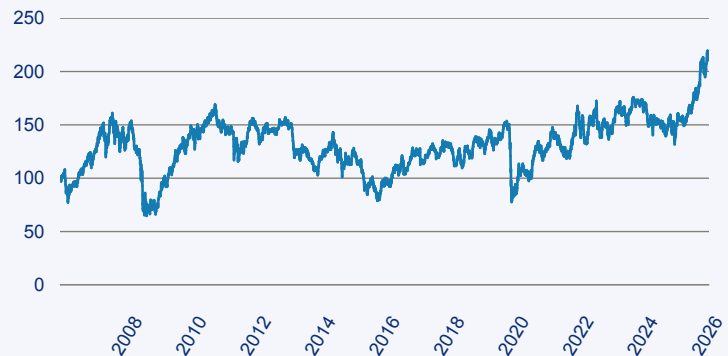
— Schroder ISF Latin American EUR A Acc

Risiko: Die in der Vergangenheit erzielte Performance und die Ertrage lassen keinen Ruckschluss auf die zukunftige Performance und die Ertrage des Fonds zu. Der Fonds ist weder mit einer Garantie noch mit einem Kapitalschutzmechanismus ausgestattet. Der in Euro umgerechnete Wert internationaler Anlagen des Fonds kann infolge von Wechselkursschwankungen (Wahrungsschwankungen) sowohl steigen als auch sinken. Der Wert des Fonds und damit der Wert ihres Investments kann gegenuber dem Einstandspreis steigen oder fallen.