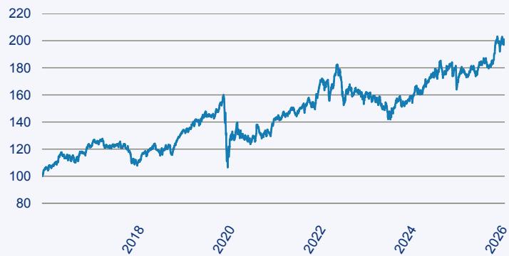
— First Sentier Global Listed Infrastructure Fund I (Accumulation) EUR

Risiko: Die in der Vergangenheit erzielte Performance und die Ertrage lassen keinen Ruckschluss auf die zukunftige Performance und die Ertrage des Fonds zu. Der Fonds ist weder mit einer Garantie noch mit einem Kapitalschutzmechanismus ausgestattet. Der in Euro umgerechnete Wert internationaler Anlagen des Fonds kann infolge von Wechselkursschwankungen (Wahrungsschwankungen) sowohl steigen als auch sinken. Der Wert des Fonds und damit der Wert ihres Investments kann gegenuber dem Einstandspreis steigen oder fallen.