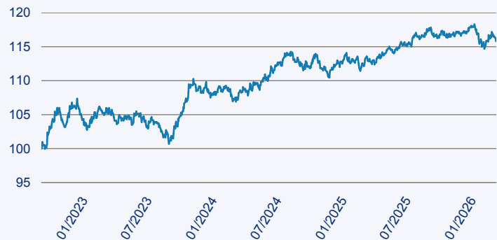
— Vanguard ESG Global Corporate Bond Index Fund EUR Hedged Acc

Risiko: Die in der Vergangenheit erzielte Performance und die Ertrage lassen keinen Ruckschluss auf die zukunftige Performance und die Ertrage des Fonds zu. Der Fonds ist weder mit einer Garantie noch mit einem Kapitalschutzmechanismus ausgestattet. Der in Euro umgerechnete Wert internationaler Anlagen des Fonds kann infolge von Wechselkursschwankungen (Wahrungsschwankungen) sowohl steigen als auch sinken. Der Wert des Fonds und damit der Wert ihres Investments kann gegenuber dem Einstandspreis steigen oder fallen.