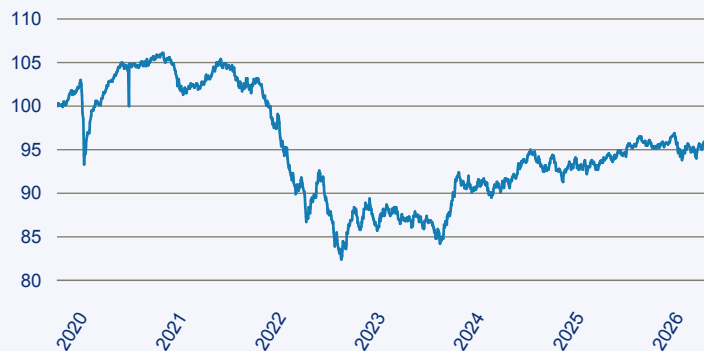
— Dimensional Global Core Fixed Income Lower Carbon ESG Screened Fund EUR A

Risiko: Die in der Vergangenheit erzielte Performance und die Erträge lassen keinen Rückschluss auf die zukünftige Performance und die Erträge des Fonds zu. Der Fonds ist weder mit einer Garantie noch mit einem Kapitalschutzmechanismus ausgestattet. Der in Euro umgerechnete Wert internationaler Anlagen des Fonds kann infolge von Wechselkursschwankungen (Währungsschwankungen) sowohl steigen als auch sinken. Der Wert des Fonds und damit der Wert ihres Investments kann gegenüber dem Einstandspreis steigen oder fallen.